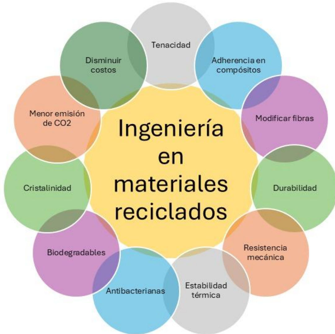
Figura 3. Líneas de investigación en materiales reciclados.

Diversos estudios señalan que la formalización de los recicladores comunitarios permite incrementar significativamente el valor económico de los residuos, al integrarlos en cadenas productivas donde pueden transformarse en insumos industriales como polímeros reprocesados, fibras recicladas o materiales secundarios (World Bank, 2018). Sin embargo, el uso de materiales reciclados en México enfrenta barreras significativas. Una de las más importantes es la percepción social, ya