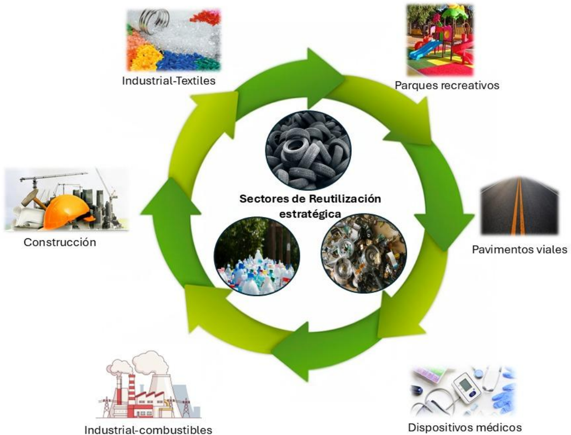
Figura 1. Aplicación de materiales reciclados en la construcción: ejemplo de hormigón modificado con caucho reciclado proveniente de neumáticos fuera de uso (NFU).

sustituyendo la mayor parte de los áridos por caucho reciclado granulado, procedente de neumáticos fuera de uso (NFU), ligada al uso de aditivos de alto rendimiento, brindando un hormigón de alta resistencia (superior a 40\text{N/mm}^2 ), con una densidad del 40% menor, es decir, 65 NFU por cada \text{m}^3 de hormigón. Además, este nuevo hormigón es producido utilizando energía solar y sin emisiones de \text{CO}_2 directas, estos datos fueron presentados en la Feria Internacional del Urbanismo y del Medioambiente ((TECMA 2024) (Neusus Urban, 2024).