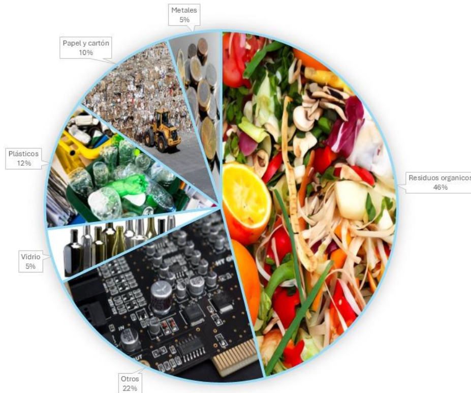
Figura 4. Distribución de residuo sólidos urbanos generados en México. ECOCE y SEMARNAT (2020).

Asimismo, la SEMARNAT reportó que, en 2020, la composición de los residuos en México estaba conformada principalmente por un 46% de residuos orgánicos, seguido de un 22% de otros materiales (como electrónicos, metales y residuos peligrosos), 12% de plásticos, 10% de papel y cartón, y proporciones menores de vidrio y metales (SEMARNAT, 2020). (Figura 4)